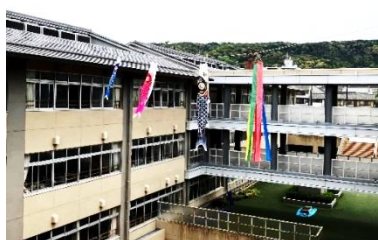
今年もこいのぼりが泳いでいます

令和7年度のスタートにあたりまして、盛況に授業参観・懇談会を終えることができたことを大変うれしく思います。今後とも、東山開晴館をよろしくお願いいたします。