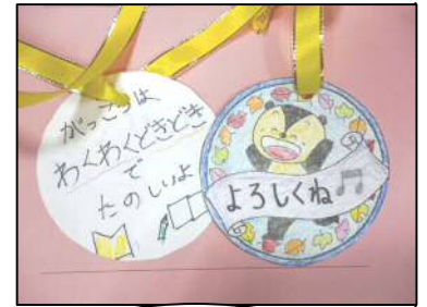
3年生児童手作 りのネックレスで

※例年行っておりまして「お迎え当番」については、今年度より行っておりません。お知りおきください。