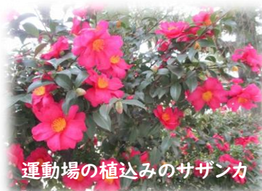
運動場の植込みのサザンカ

昨年度にもお伝えしておりますが、強風等により学校の玄関に枯葉等がたくさん吹き込んできてしまいます。心がけて清掃をしてはおりますが、掃いた直後から再び風が吹きこんでいきます。皆さまをお迎えする玄関ですので、冬季の間、日によっては扉を閉めることがあります。施錠はしませんので、ご自由にお入りいただけます。ご理解のほど、よろしくお願いいたします。