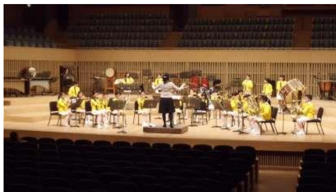
＜本番前リハーサルの様子（HPから）＞

HPでも紹介していますが、1月28日（日）に京都コンサートホールで行われた第42回京都ビッグ・バンド・フェスティバル（京都市・京都市芸術文化協会主催、京都府吹奏楽連盟協力）に、本校ドリームバンドが京都府小学校吹奏楽連盟の代表として出演しました。新聞でも紹介されています。