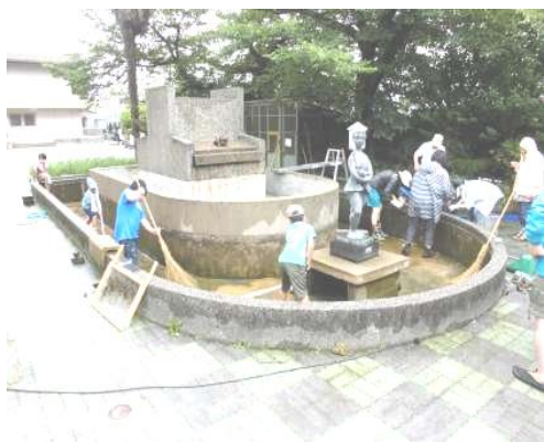
<池掃除>子ども達も参加しました。

5月14日（土）には体験学習支援として親子で参加できる「みどりのカーテン」づくりを開催していただきました。また、5月22日（日）には水田づくりと田植え作業をしていただき、6月25日（土）には午後から池の掃除をしていただきました。ありがとうございます。日々の学習にも活用させていただいています。