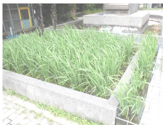
<水田づくり>こんなに成長してきました。