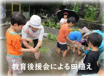
教育後援会による田植え

一方で、本校の子どもたちは、地域の方々とうちで挨拶ができているのかしら?と思うことがあります。保護者の皆さま、地域の皆さま、いかがでしょうか。PTAはじめ、見守り隊の皆さんにもいつも児童の安全な登下校に向け、見守りをいただき、感謝しております。大きな声で自分から爽やかに挨拶ができるに越したことはありませんが、中には、恥ずかしがり屋の子どももいますので、笑顔を作ったり、手を振ったり、それぞれの表現や対応があればよいと思っています。ぜひ、私のように、子どもたちや地域の皆さんも、挨拶を通してお互いに爽やかな朝を迎えられたらと思います。