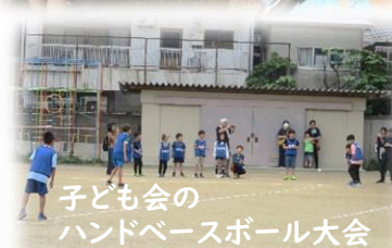
子ども会の ハンドベースボール大会