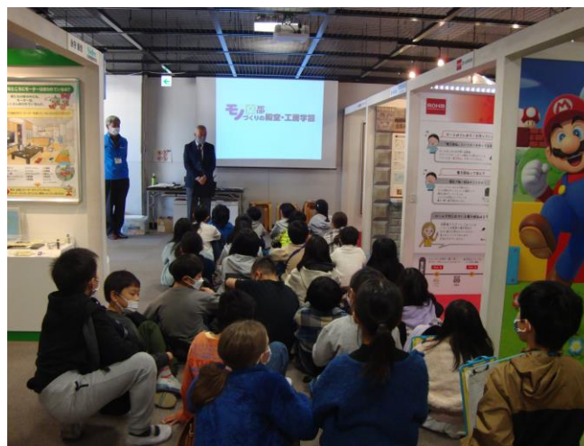
4年生 モノづくりの殿堂・工房学習