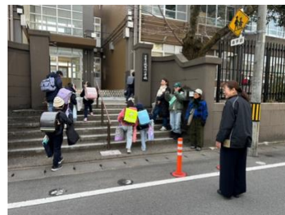
長期休み明けの初日は校長先生や「あんサガ」さんと一緒に「あいさつ運動」を実施しています。