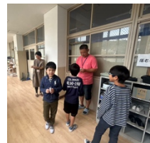
PTA だよりクイズの プレゼントを渡す会長