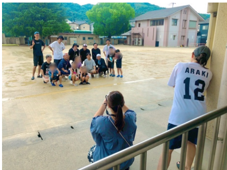
水かけ大会終わりの「おやじの会」の 写真を撮りまくる広報チーム

学校行事や PTA 活動取材を通して、子ども達や PTA 会員のみなさんの生き生きとした表情や様子がたくさん集まっています。