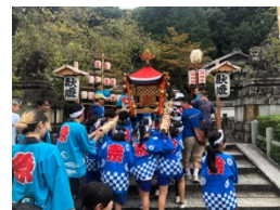
わっしょい！「子ども神輿」