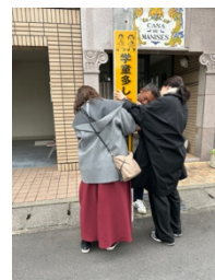
おニューの看板に