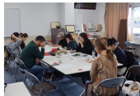
オープンミーティング