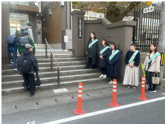
／おはようございます！／