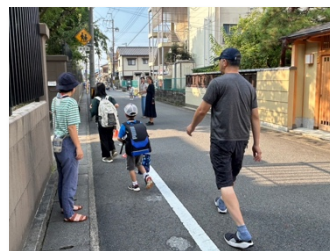
2学期初日のあいさつ運動