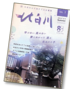
広報誌『北白川』2025年1号紙

2学期もPTA活動の今が伝わる“読まれる紙面”を目指し、活動 していきます！どうぞお楽しみにしてください。