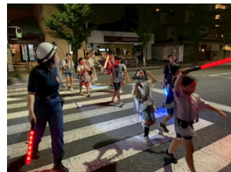
「消防団 夜回り」で元気に火の用心！