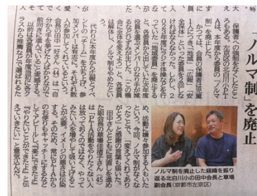
カラーで掲載された京都新聞の記事