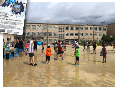
白熱した「水かけ大会」