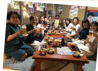
「お疲れさん会」(もろん屋)です