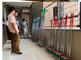
新しい竹馬が登場！

予告) 夏休みには「消防団夜回り」、2学期には「体育服リユース」や「子ども神輿」などを予定。