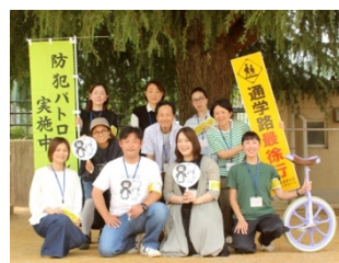
本部メンバー集合写真