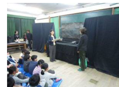
おはなしわくわく