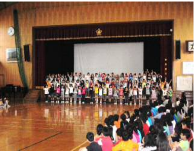
<1年生をむかえる会>