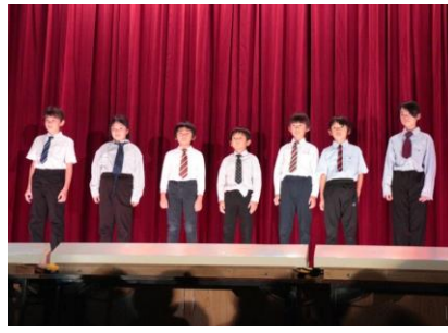
3・4年 何でも引受会社