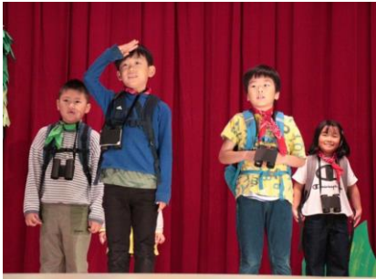
1・2年トレジャーハンターXX

令和5年度の文化祭が開催されました。ここ数年続いていた観覧者の制限や、換気・距離をとる等の感染防止対策が必要なくなり、コロナ禍前の発表に戻すことができました。前期ブロックの2学年合同発表や舞台に集合しての全校合唱、長椅子に友達と一緒に座って鑑賞する姿や保護者・地域の皆様にたくさん参観していただけたことなど、心に残る文化祭になりました。