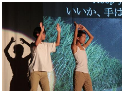
9年 シムクガマの奇跡