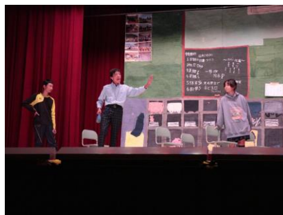
7年 7人の優しい中学生