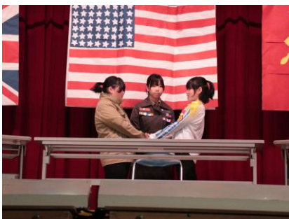
6年あなたはどうかながえますか？