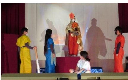
5年生 「しばいのすきな えんまさん」