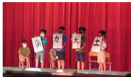
3年生 「ある ある 3年教室」