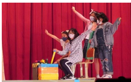
4年生 「タイムマシンDE(で)GO!!」