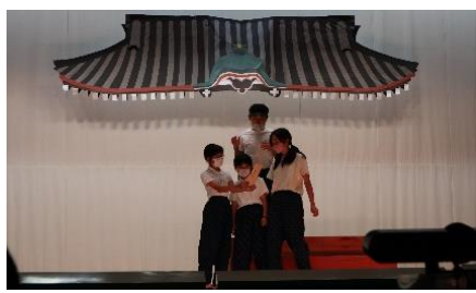
6年生 「さっちゃんからの手紙」