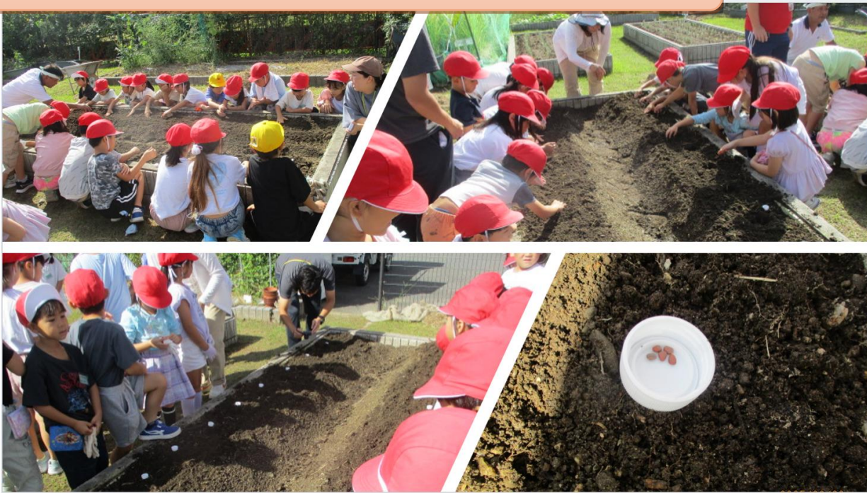
1年生 聖護院大根種まき