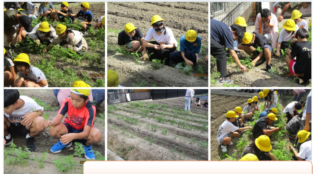
6年生 金時人参間引き