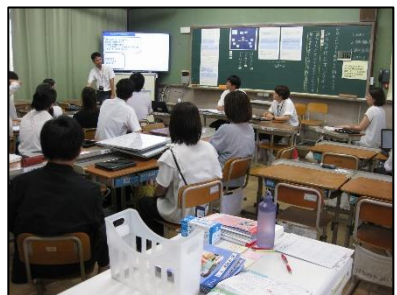
授業研究・授業公開

子どもたちが「分かった」「できた」と実感しながら、進んで学習に取り組めるようにすることを大切にしています。