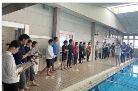
スポーツプラザエースとの連携 （事前研修・水泳指導）