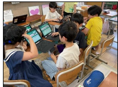
各教科および総合的な学習の時間(SHOHO タイム)の様子