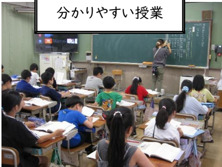
分かりやすい授業

分かりやすい授業と一人一人に応じた指導を通して、安心して学べる環境づくりを進めています。