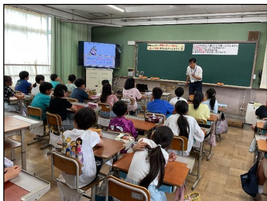
5年生 非行防止教室