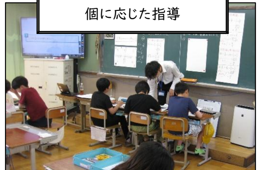
安心できる教室環境