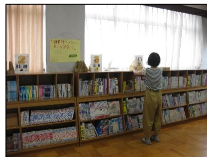
学校ボランティアの方との連携 （図書・家庭科・校区探検等）