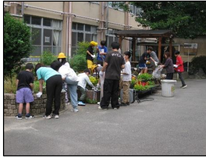
主体的な委員会活動