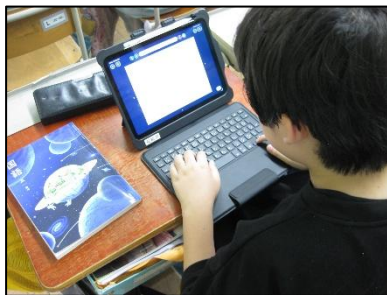
1人1台 GIGA 端末の活用