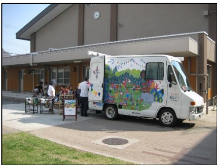
日本新薬移動図書館 「キラキラ未来ゴー」