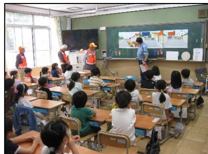
1年生 交通安全教室