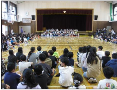
京キッズ会議に向けてオンライン会議