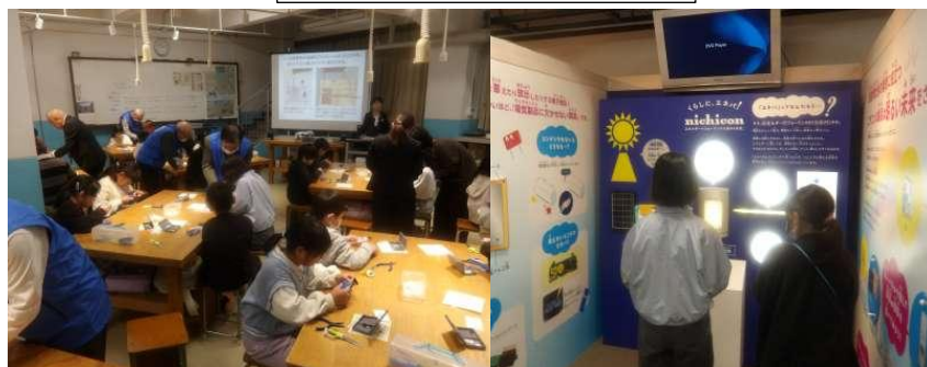
モノづくりの殿堂・工房学習