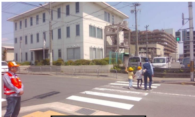
1年生 交通安全教室