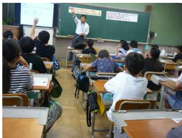
5年生 非行防止教室