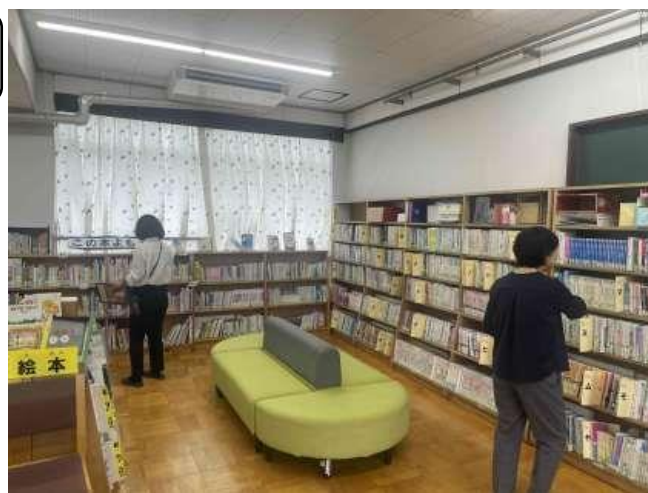
学校ボランティアの方との連携（図書・家庭科等）