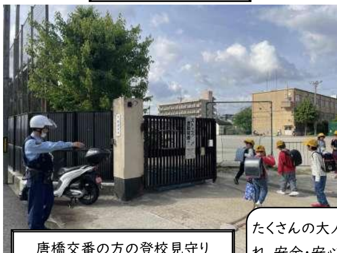
唐橋交番の方の登校見守り