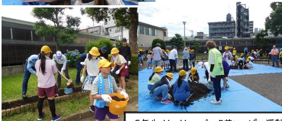
5年生 YouYou パーク花いっぱい運動