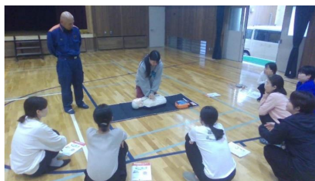
教職員・PTA 合同救急救命法研修会