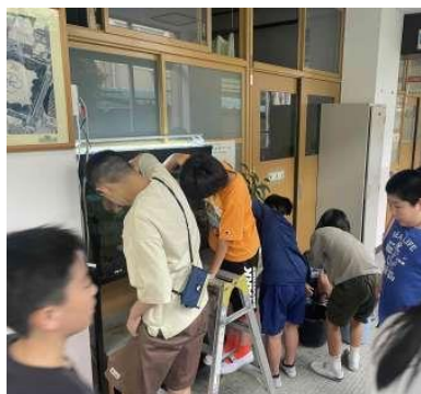
主体的な委員会活動