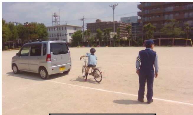
4年生 自転車安全教室