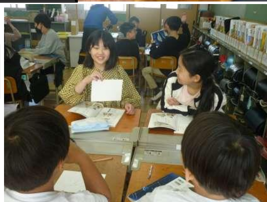
ペアやグループでの活発な話し合いの様子