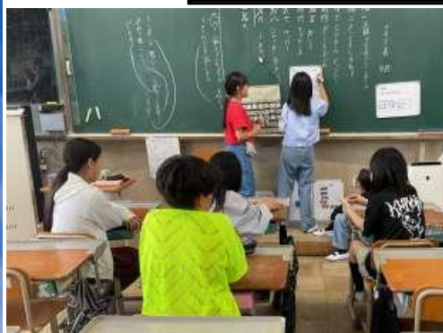
放課後掃除隊 作戦会議