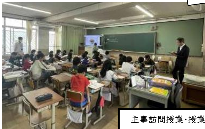
主事訪問授業・授業後の話し合い