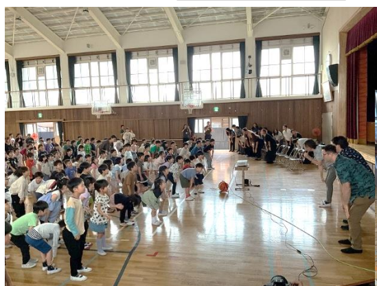
ハワイ大学との交流