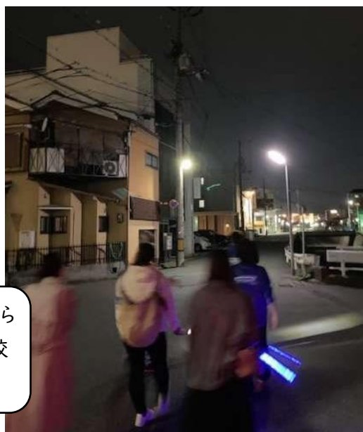
少年補導・PTA・地域の方との夜間パトロール