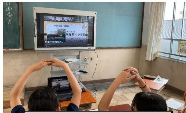
京キッズ会議に向けてオンライン会議