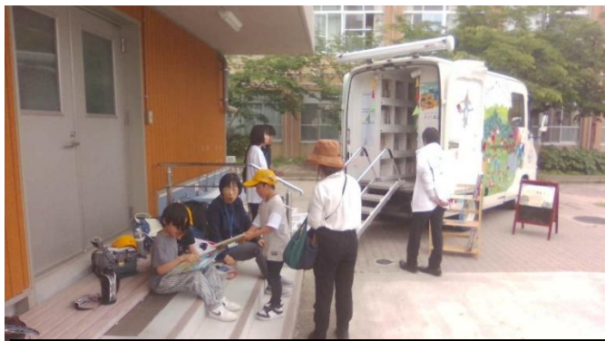
日本新薬移動図書館「キラキラ未来ゴー」