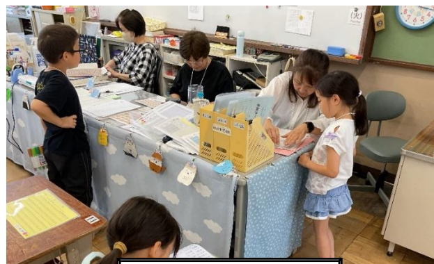
放課後まなび教室