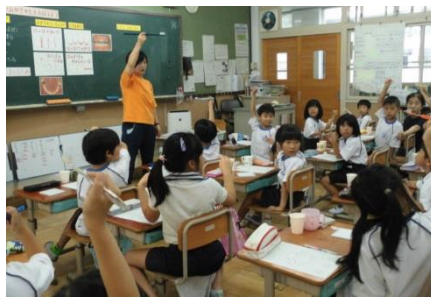
ピカピカしらべ（歯磨き指導）

長期休業明けの生活しらべて規則正しい生活を児童が意識できるようにしています。2学期からは、給食後歯磨きも、希望制で始めています。児童が健康に過ごせるようにご家庭と協力して取組を進めてまいります。