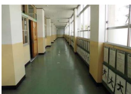
3年生廊下のペンキの塗り替え