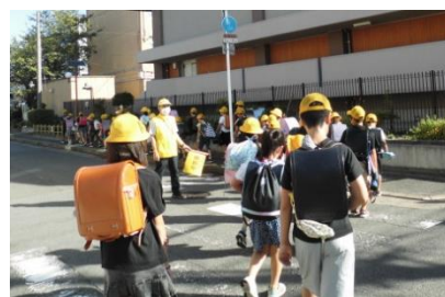
登校時の見守り活動