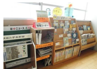
こども新聞・季節の本コーナー