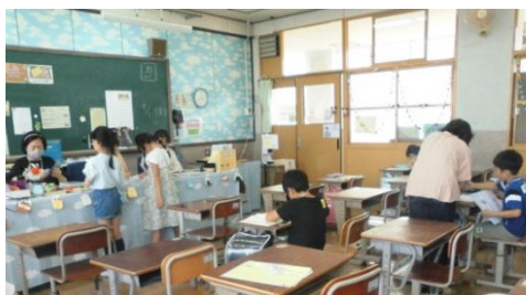
放課後まなび教室