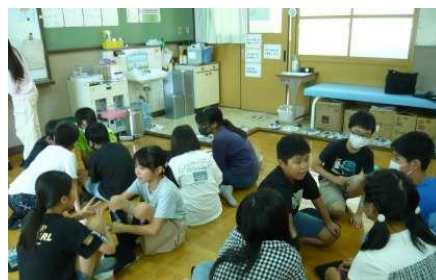
委員会活動(保健委員会)

読書を楽しめる環境づくりや様々なジャンルの本に親しめるような工夫を行っていきたいと考えます。