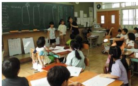
1年 国語「絵日記発表」

すべての子どもが「学校が楽しい」と感じられるように授業改善や取組の精選を行ってまいります。今年度は、学年での校外学習、地域・企業・大学・関係機関等の外部と連携した取組を実施しています。外部との連携した学習は、関係の皆様方のご支援ご協力のもと実施することができ、子どもたちの豊かな体験となっています。