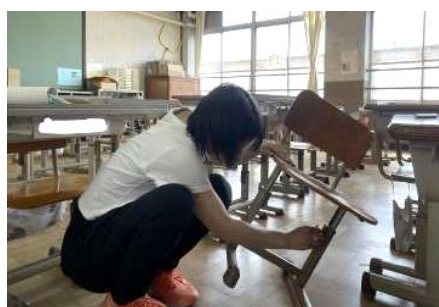
机・いすの高さ調節