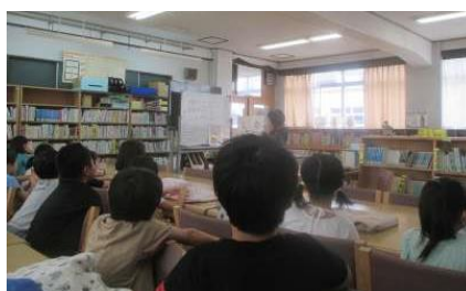
学校図書館司書による読み聞かせ

読書を楽しめる環境づくりや様々なジャンルの本に親しめるような工夫を行っていきたいと考えます。