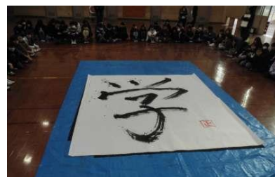
掲示中の「今までに選ばれた漢字」と「大きな紙に書かれた昨年の文字」と「昨年度の様子」