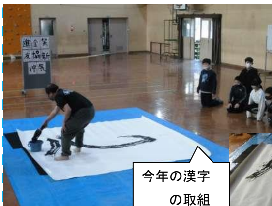
今年の漢字 の取組