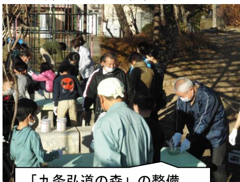
「九条弘道の森」の整備