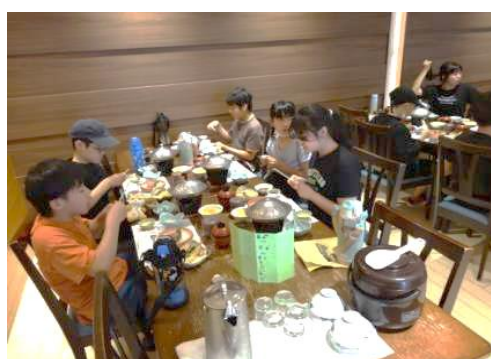
6 年生：修学旅行 和歌山方面