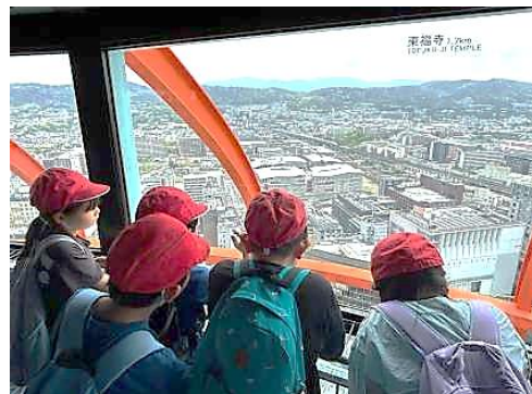
3 年生：校外学習京都タワー