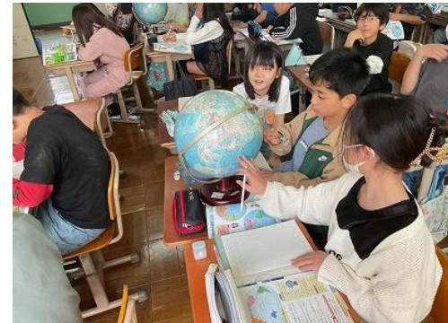
5 年生：社会科 地球儀をつかって