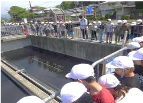
4 年生：校外学習浄水場見学