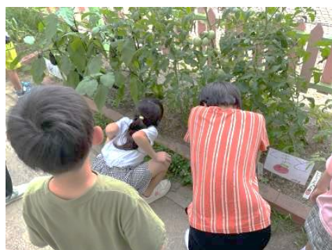
さくら：生活単元 野菜を育てよう