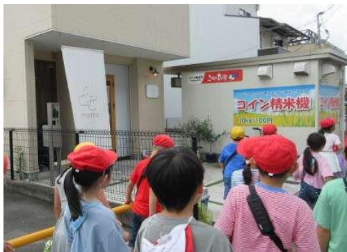
2 年生：生活科 地域たんけん