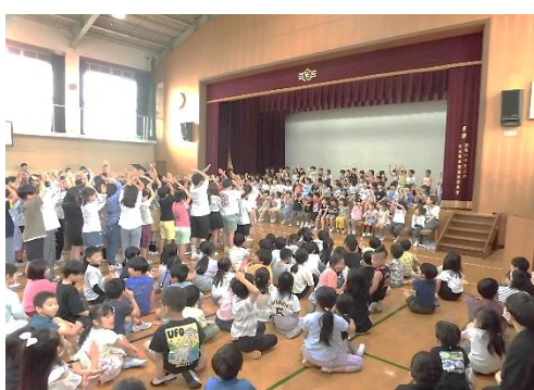
全校：1 年生を迎える会