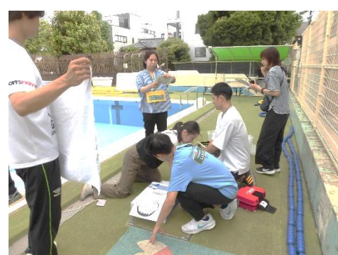
教職員：実地訓練（HANA モデル）