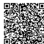
証明書 QR コード