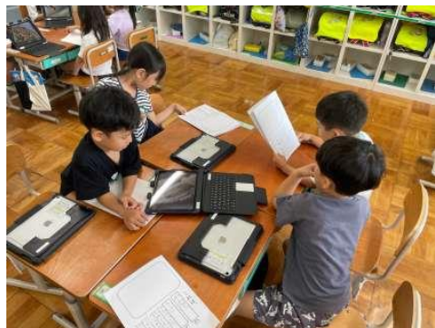
1 年生：国語科 クイズ大会

1 学期、七条第三小学校の子どもたちは、新しい学年のスタートにそれぞれの目標を持ち、日々の学習や活動に一生懸命に取り組みました。朝の挨拶運動や日々の学習、友だちとの関わりの中で、たくさんの「できた!」を積み重ね、心も体も大きく成長しました。保護者・地域の皆様におかれましては、様々な場面でご理解とご協力を賜り、本当にありがとうございました。今後ともどうぞよろしくお願いいたします。