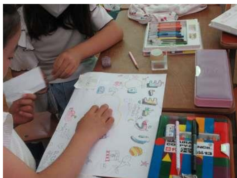
事前にポスター作り

7月15日(土)に、4年ぶりに本校の3年生が参加し、「サマーナイトフェスティバル」が開催されました。七条中央サービス会の方々の協力のもと、夜店のお手伝いをさせていただきました。3年生の子どもたちも、大きな声でお客さんを相手にはりきっていました。本校が取り組んでいるハナヤ学習の一環として、いろいろなお店の店員になって働く経験は、人との関わり方やものの見方・考え方に必ず生きていきます。なによりも、子どもたちが笑顔で一生懸命に取り組んでいる姿がとても素敵でした。子どもたちの活躍のおかげで、「サマーナイトフェスティバル」は大盛況でした。