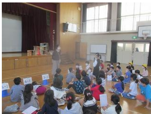
放課後まなび教室開き

5月16日の朝から、読み聞かせが始まりました。今年度も読み聞かせボランティアの方が、火曜日に月2回ほど子どもたちに読み聞かせに来てくださいます。また、担任以外の教職員がいろいろな学級で読み聞かせをすることもあります。楽しみにしてください。