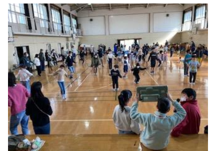
子どもたちも進行を手伝ってくれました。