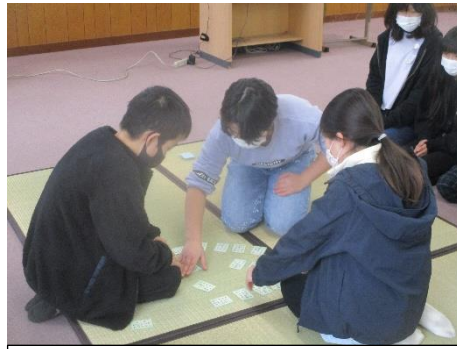
多目的室で代表戦、決勝戦