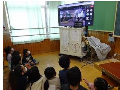
教室からの応援も 大盛り上がり