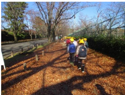
落ち葉の道を歩きました

11月25日に植物園に校外学習に行きました。素晴らしい天気の中、色づいた景色の中で子どもたちはクイズラリーをグループで協力して楽しみました。行き帰りのバスでも、ルールやマナーをきちんと守り、立派な姿を見せてくれていました。