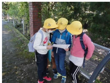
グループで協カラリー中