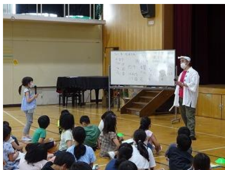
ハナヤ学習で地域の方と たくさん関わりました