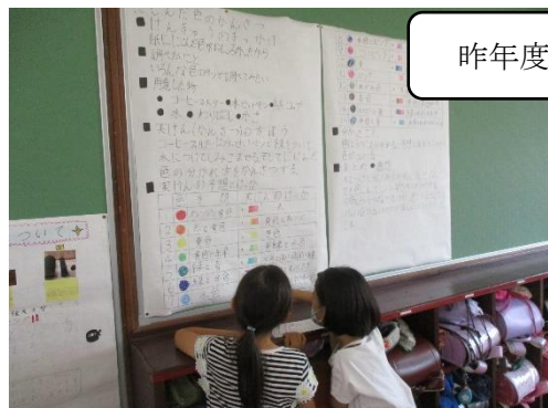
教室で交流をしました

場 所 体育館 (入場の際は、体育館入口の表へ記名していただきますようお願い致します。)