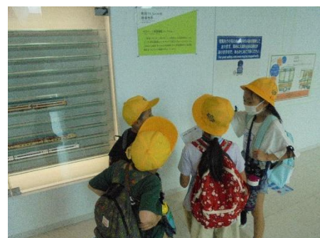
遠足で友達と協力して 班行動ができました