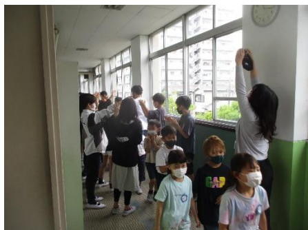
1年生をむかえる会で みんながお祝いしてくれました