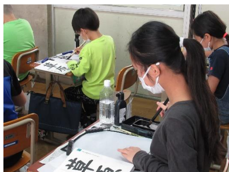
最高学年として 集中する姿を見せてくれました