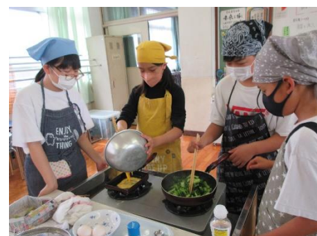
初めての調理実習 協力して上手にできました