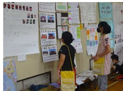
他の学年の自由研究を鑑賞