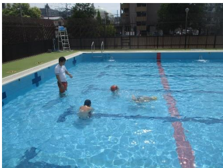
水泳をがんばりました

これからも、子どもたちのよさをたくさん見つけ、輝く姿をたくさん増やしていきたいと思います。1学期間ありがとうございました。