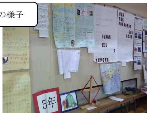
子どもたちの力作がそろいました