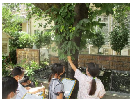
自然にふれる経験を たくさんしました