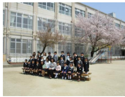
記念撮影；桜を背景に