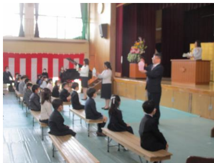
担任発表；しっかり聞いています