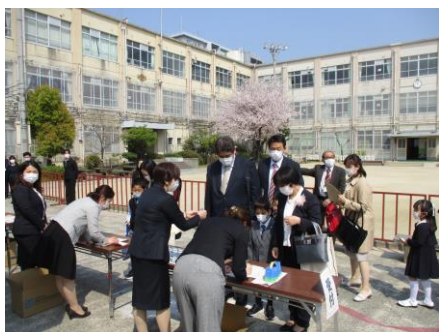
受付；もうすぐ入学式

入学式は、式の時間短縮や参加者の限定など、いろいろなところでご迷惑をおかけしましたが、晴天の下、無事行うことができました。新しい服に身を包み、話をしっかり聞く新1年生の姿はとても立派でした。