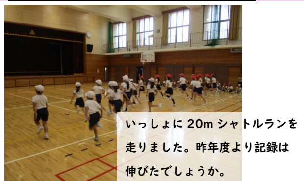
いっしょに20mシャトルランを走りました。昨年度より記録は伸びたでしょうか。