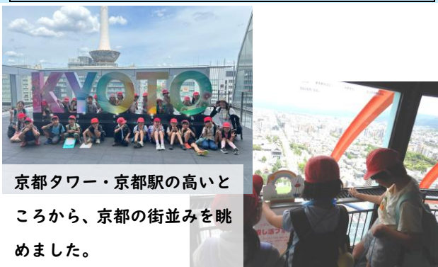
京都タワー・京都駅の高いところから、京都の街並みを眺めました。