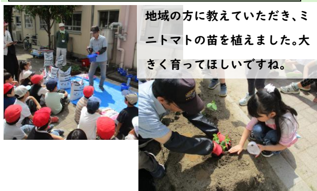
地域の方に教えていただき、ミニトマトの苗を植えました。大きく育ててほしいですね。