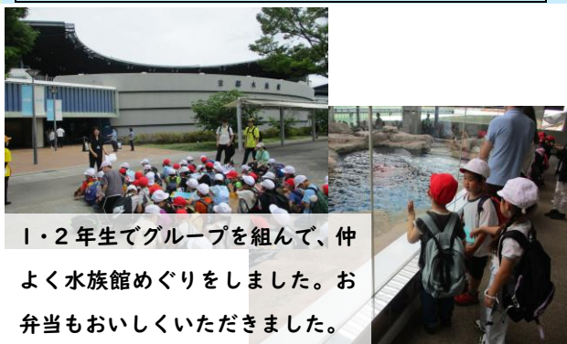
1・2年生でグループを組んで、仲よく水族館めぐりをしました。お弁当もおいしくいただきました。