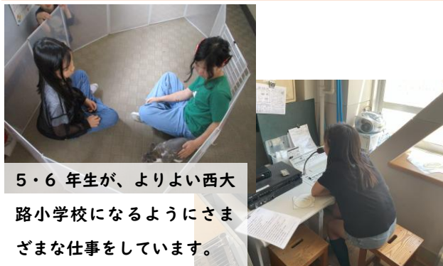
5・6年生が、よりよい西大路小学校になるようにさまざまな仕事をしています。