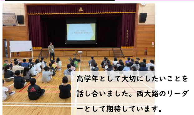
高学年として大切にしたいことを話し合いました。西大路のリーダーとして期待しています。