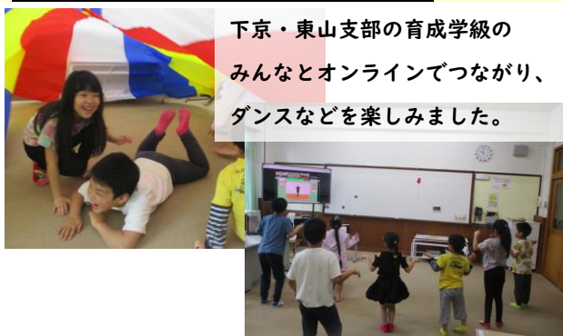
下京・東山支部の育成学級の人々とオンラインでつながり、ダンスなどを楽しみました。