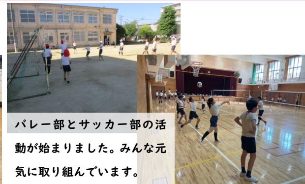
バレー部とサッカー部の活動が始まりました。みんな元気に取り組んでいます。