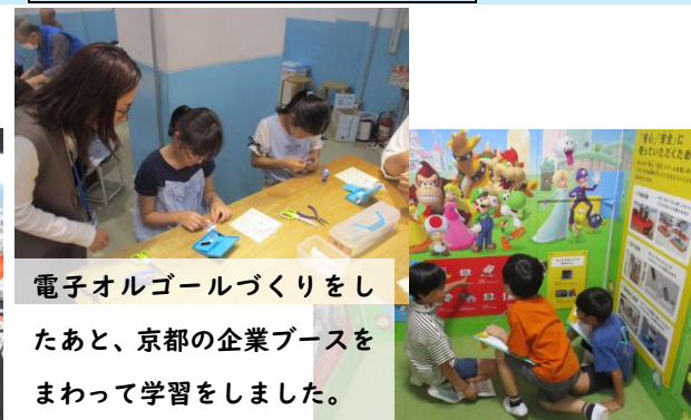
電子オルゴールづくりをしたあと、京都の企業ブースをまわって学習をしました。