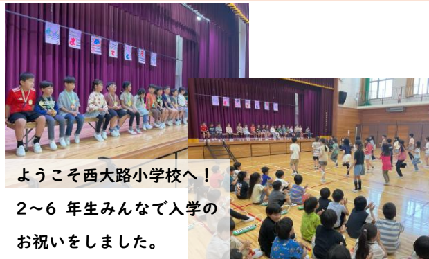
ようこそ西大路小学校へ！ 2～6年生みんなで入学のお祝いをしました。