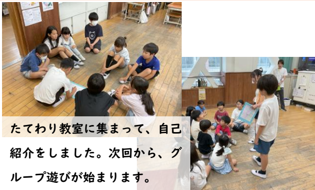
たてわり教室に集まって、自己紹介をしました。次回から、グループ遊びが始まります。