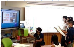
学校クイズや学校紹介の様子