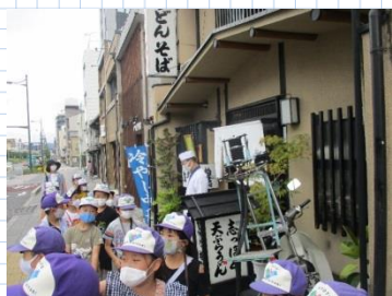
町探検を楽しむ様子

先日のハーモニーフェスティバルでは、多くの参観をしていただき、ありがとうございました。このコロナ禍において、子どもたちの思いや考えを表出する機会を創出工夫をしながら開催することができました。下京雅五大フェスティバル第二弾は、スポーツフェスティバル。今年度は、初の二日間開催を予定しています。感染症対策を講じながらの開催となりますので、競技内容・演技内容・進め方・観覧の仕方など、例年とは異なる点があるかと思えます。今できる最大限の工夫をしながら、みんなで創り上げていきたいと思えます。詳しくは、プログラムでご案内しています。ご確認ください。