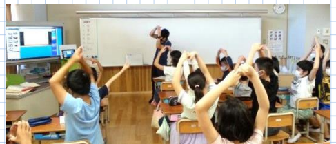
小中交流会を楽しむ様子

盛り上がりがあったり、それぞれの学校にしかないことを知って驚いたりしながら、楽しんで参加する姿が見られました。楽しい会にしようとしてくれていた中学生の様子を見て、「さすがやなあ。」「中学生、優しいなあ。」という声も聞こえてきました。 最後に、下京中学校の学校紹介と部活動紹介のビデオを見ました。自分が興味のある部活動が紹介されると、「わあ、楽しそう！」など声が上がっていました。中学校への期待が高まる機会になりました。【6年 谷本 彩子】