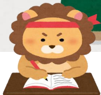
がむしゃライオン