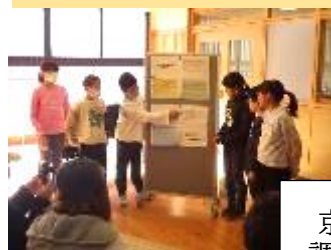
京野菜について 調べたことを発表