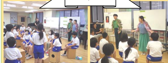
「魔笛」よりパパゲーナとパパゲーノの二重唱