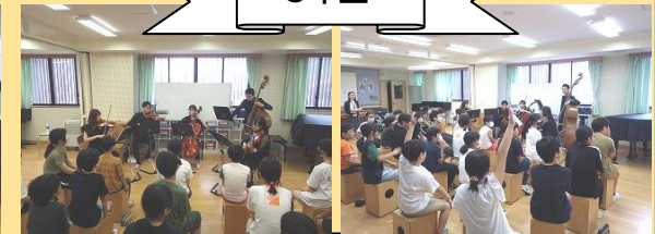
アイネクライネナハトムジーク