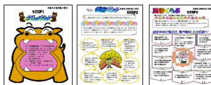
<読書の観点カード>