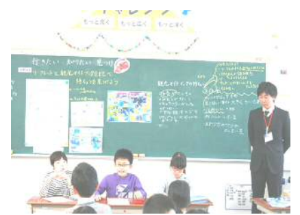
子どもによる司会・進行