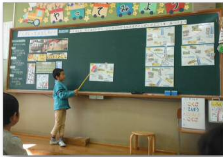
<1年 かんばんっておもしろい！>