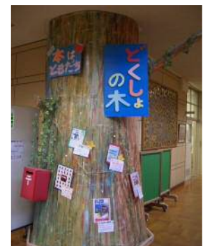
<読書をしなくなる環境づくり>