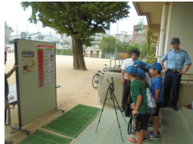
「令和6年度 30周年フェスタ 午前の部」 御所南コミュニティ 6つの部会からテーマに応じた楽しい講座を開く