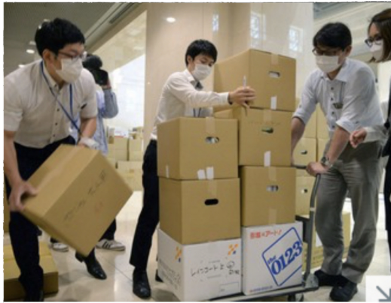
医療機関に配布するため運び出される市民から寄付された雨がっぱの入った段ボール箱＝大阪市役所で2020年5月11日午後2時35分