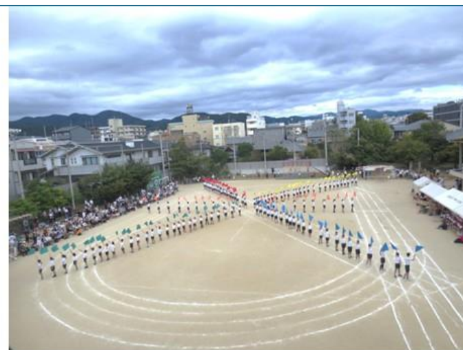
5・6年生団体演技 挑む