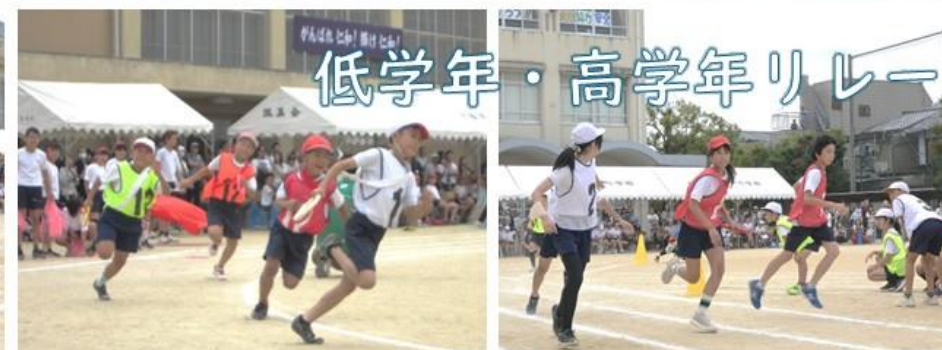
低学年・高学年リレー