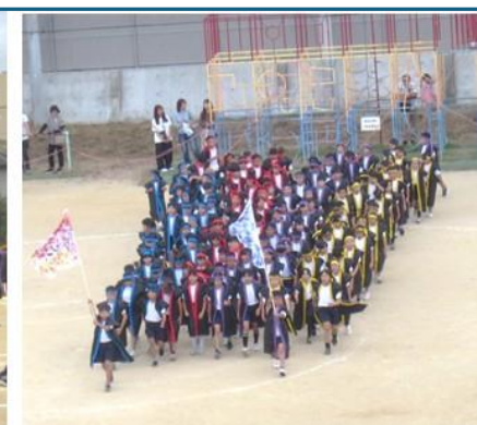
3・4年生団体演技 仁和 爽RAN!!～ひびけ 私たちの声～