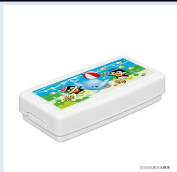
⑦粘土ケース (へら付) ¥300