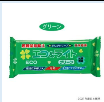
⑧油ねんど (グリーン) ¥580