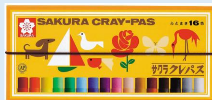
⑥クレパス (16色) ¥720