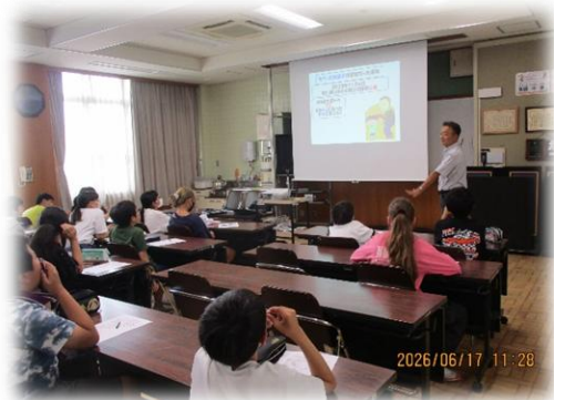
6年生上京警察署スクールサポーターによる非行防止教室

に、ものをもらったりついて行ったりしません。」とすらすらと話せます。先日実施した上京署スクールサポーターの方にゲストティーチャーとして来ていただいた、非行防止教室においても、子どもたちは「やっていいことだめなこと」を適切に回答し、ロールプレイで演じていました。すでに始まっている水泳学習では各担任の先生は「水泳学習は命を守る学習でもある」ことを子どもたちに伝え、日々指導に当たっています。これらの、理論、目的、趣旨を理解し知っていることはもちろん大切なのですが、そこからさらに大切なことは、知っていることをどう使うか、ここで言うなら知っているだけでなく、いかにこれらのことを『自分ごと』として捉えているか、だと思えます。よく考えたら悪い、と頭ではわかっていることをその時はついうっかりやってしまいました、廊下を走ることはよくないと知っているけど急いでいて周りに人もいないので大丈夫と思い走ってしまいました、などなど。自分には事故は起こらない、ニュースになるような出来事は対岸の火事で、自分には関係がないと思ってしまう。人との関係においても、後から考えたら相手を傷つけてしまうような言動だったけど、その時はついでに言ってしまった、これも自分が言われたらどうだろう、と「自分ごと」として考えられていない、「自分ごとへのハードル」があるように思えます。