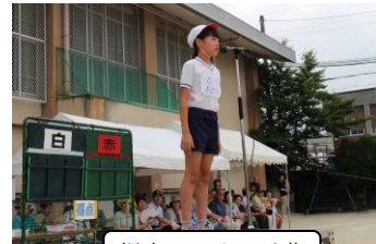
児童はじめの言葉