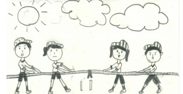
4年 今井 幸穂