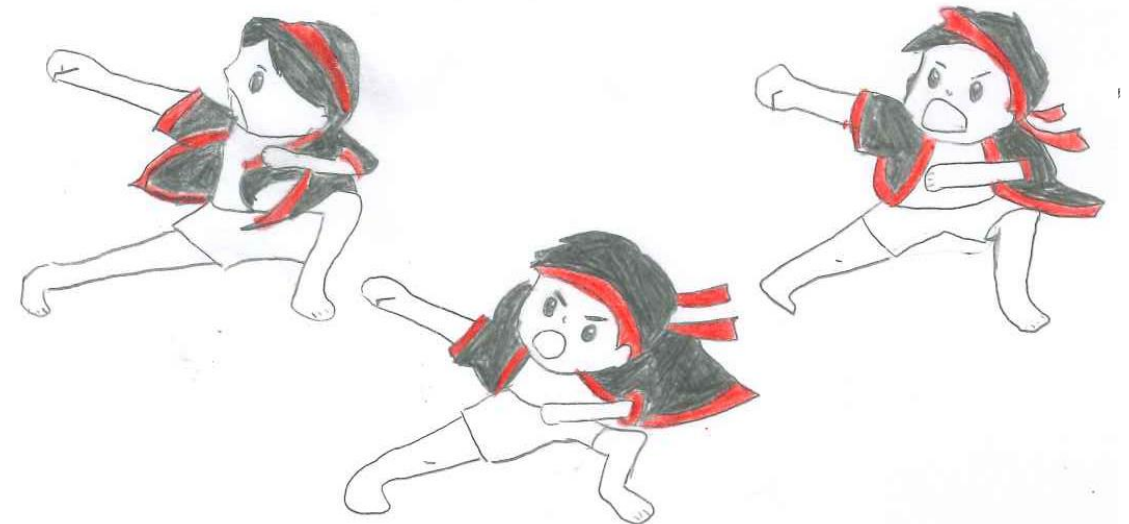
4年 カンダボダ 愛良イマンサ