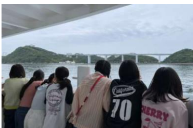
うずしおクルーズ