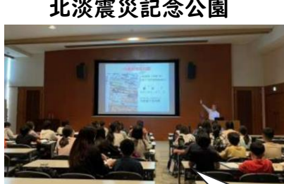
北淡震災記念公園