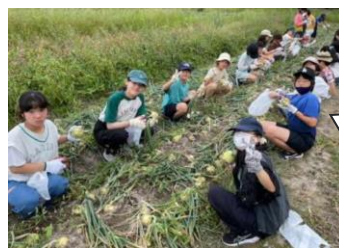
淡路島牧場 玉ねぎ収穫体験

語り部さんのお話を聞いたり地震の爪痕を実際に見たりし、「備え」の大切さを改めて感じました。