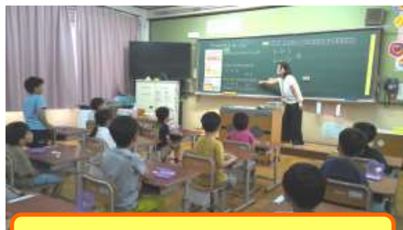
1年い組 算数「3つのかずのけいさん」