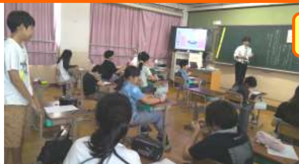
6年い組 学活「自分らしさを大切にしよう」