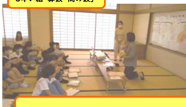
5年い組 学活「うまれてきてくれてありがとう」