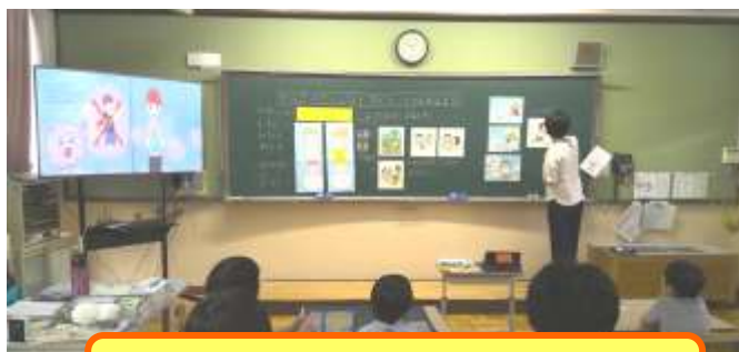
ろ組 学活「プライベートゾーンをまもろう」

また、4校時には、体育館でPTA特別委員会主催の「元町教育を考える会」が行われました。特別委員会の方から、活動についての説明があり、その後、質疑応答がありました。