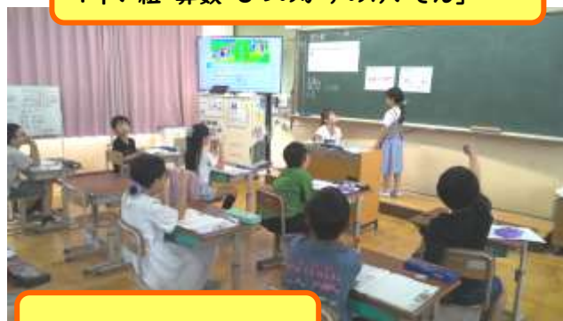
3年い組 算数「間の数」