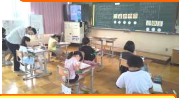
2年い組 算数「買えますか？買えませんか？」